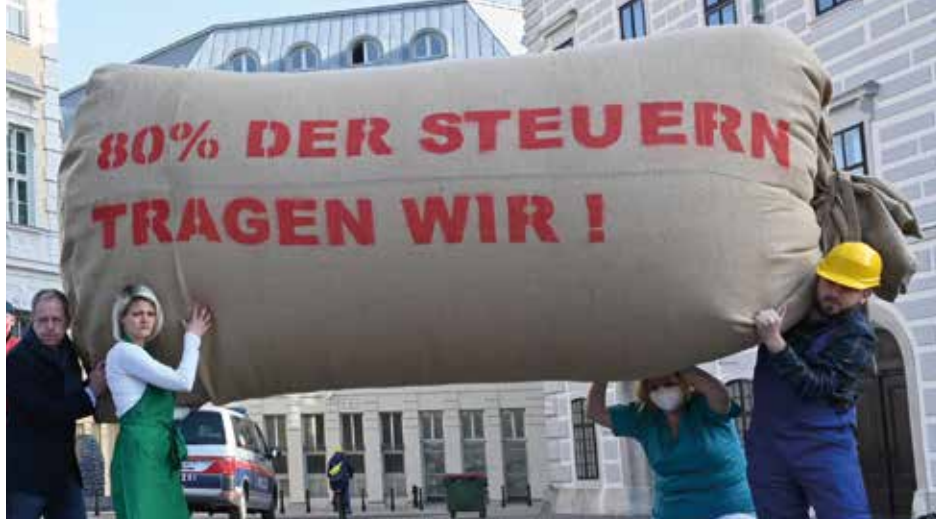
Aktion vor dem Bundeskanzleramt in Wien

schaft sowie Versorgungs- und Rohstoff-sicherheit sind zu stärken.