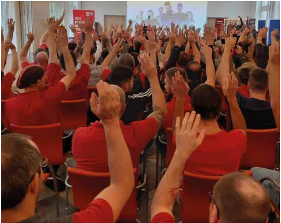
Kollektivvertragsverhandlungen 2022: Betriebsversammlung im Miele Werk

Die innerbetriebliche Mitbestimmung soll gestärkt werden und die Ver- oder Behinderung von Betriebsratswahlen gerichtlich strafbar gemacht werden.