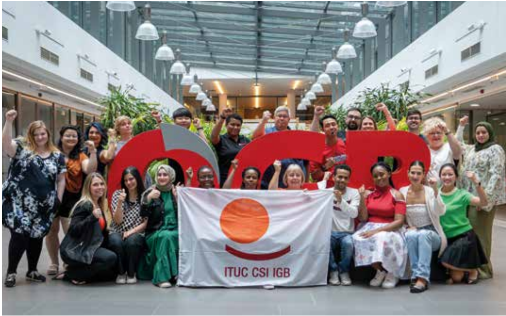
2022: Lehrgang für junge internationale Gewerkschafter:innen in Wien

den Vordergrund. Später beteiligte sich der ÖGB an Solidaritätsaktivitäten gegen diktatorische Regime (Chile, Portugal oder Spanien), gegen den Vietnamkrieg oder die südafrikanische Apartheidpolitik. In den 1970er Jahren stand die immer größer werdende Kluft zwischen Industrie- und Entwicklungsländern im Mittelpunkt des Engagements.