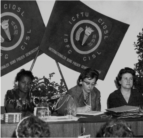
1955: IBFG-Weltkongress in Wien