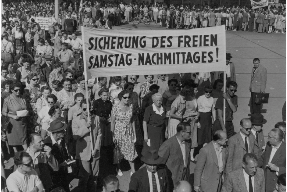
1952: Streik der Wiener Handelsangestellten

Problem waren die „gelben Gewerkschaften“: Als vom Unternehmen direkt abhängige Betriebsorganisationen fungierten sie vor allem als Streikbrecher.