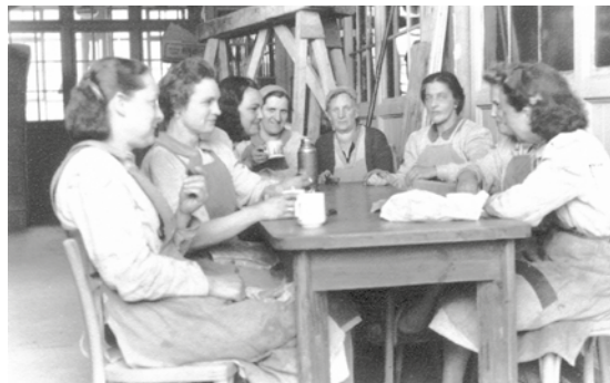
1944: Pause in der Bäckerei Anker

von Arbeiter- und Soldatenräten. Die sozialpolitisch Verantwortlichen der Ersten Republik reagierten auf diesen Unmut und schufen z. B. das Betriebsrätegesetz (1918), das Kollektivvertragsgesetz (1919) oder die Arbeiterkammern (1920). Bis 1934 konnten weitere Errungenschaften wie die Einführung des Achtstundentages oder einer Arbeitslosenunterstützung durchgesetzt werden. Zwar waren die Gewerkschaften zu diesem Zeitpunkt schon überregional und branchenweit organisiert, politisch jedoch waren sie in sozialdemokratische, christliche, deutschnationale und andere Richtungsgewerkschaften zersplittert. Sie arbeiteten oft gegeneinander, was zu einer Schwächung der Bewegung insgesamt führte. Ein zusätzliches