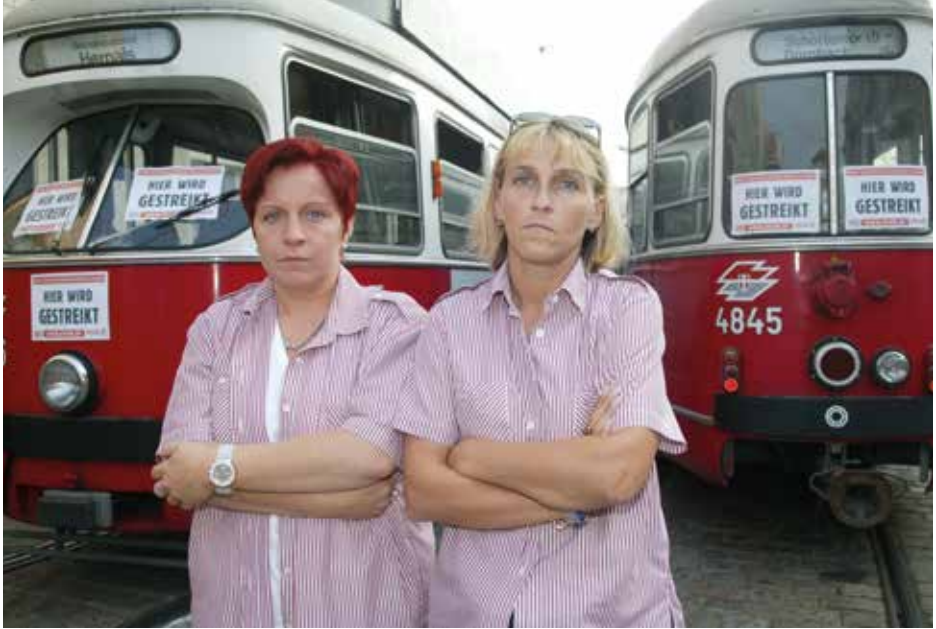
2003: Arbeitsniederlegung im Betrieb. Die Straßenbahnen stehen still.