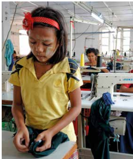
Herstellung von Schuluniformen unter Einsatz von Kinderarbeit. Myanmar, 2013.

eine aktive Außen- und Friedenspolitik auf Basis der Neutralität betreiben. Weiters soll eine gestärkte internationale Gewerkschaftskooperation vor allem mit den Ländern des Globalen Südens gestärkt werden. Zu den globalen Herausforderungen gilt es die Fluchtursachen und nicht Menschen zu bekämpfen. Dafür müssen neue Standards für gerechteres Wirtschaften, wie zum Beispiel Lieferkettengesetze, beschlossen werden, um die Ausbeutung der arbeitenden Menschen nachhaltig global zu verhindern.