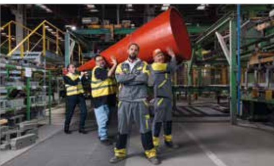
ÖGB-Kampagne "Mir reicht's"

Eine weitere ÖGB-Kampagne mit dem Titel "Mir reicht's" lief zwischen April und Dezember 2021 und hatte zum Ziel, die Gründung neuer Betriebsratskörperschaften zu initiieren. Ausgehend von einer Umfrage und Erfahrungsberichten über Betriebsrät:innen in den Massenme-