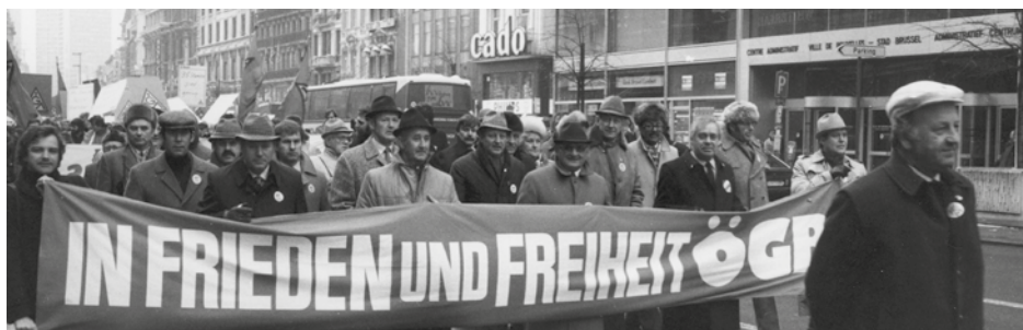
1983: EGB-Demonstration in Brüssel. Bis heute beteiligt sich der ÖGB regelmäßig an den Aktionen des Europäischen Gewerkschaftsbundes.

Es gilt jetzt die Sozialpartnerschaft als starke Einrichtung wieder zu installieren und zwar langfristig, um die Herausforderungen von heute und morgen für die Arbeitnehmer:innen und für den Standort Österreichs bestens zu meistern.