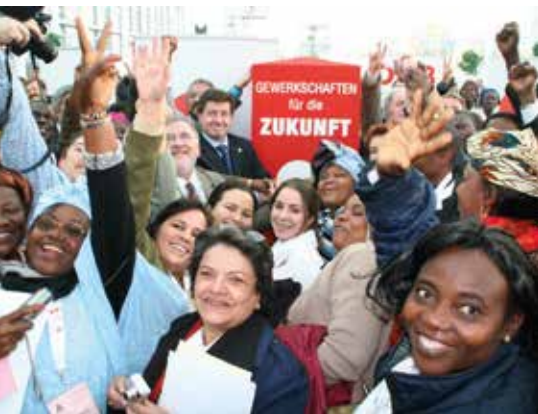
2006: IGB Gründungskongress in Wien

Der ÖGB sprach sich – auch als Lehre aus der Geschichte der zersplitterten Gewerkschaften in Österreich vor dem zweiten Weltkrieg – gegen die Konkurrenz gewerkschaftlicher Verbände auf globaler Ebene aus. Er unterstützte daher den Gründungsprozess eines neuen Internationalen Gewerkschaftsverbandes, zusammengesetzt aus Mitgliedsorganisationen der aufgelösten Verbände IBFG und WVA sowie aus bisher international nicht affiliierten Verbänden. Die Abhaltung des Gründungskongresses des Internationalen Gewerkschaftsbundes (IGB) am 1. November 2006 in Wien war eine große Anerkennung des Bestrebens des ÖGB um globale Gewerkschaftseinheit.