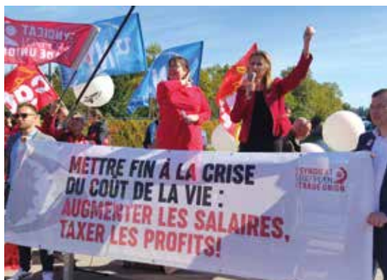
2022: EGB-Demo in Brüssel

Auch dem 1973 gegründeten Europäischen Gewerkschaftsbund (EGB) gehört der ÖGB als Gründungsmitglied an. Dem EGB kommt zwar heute eine Schlüsselrolle bei der Vertretung gewerkschaftlicher Interessen gegenüber den Europäischen Institutionen zu, er war aber zu keinem Zeitpunkt exklusiv nur für Organisationen aus Mitgliedsländern der Europäischen Wirtschaftsgemeinschaft (EWG) bzw. späteren Europäischen Union (EU) bestimmt, sondern immer an den geografischen Grenzen Europas orientiert.